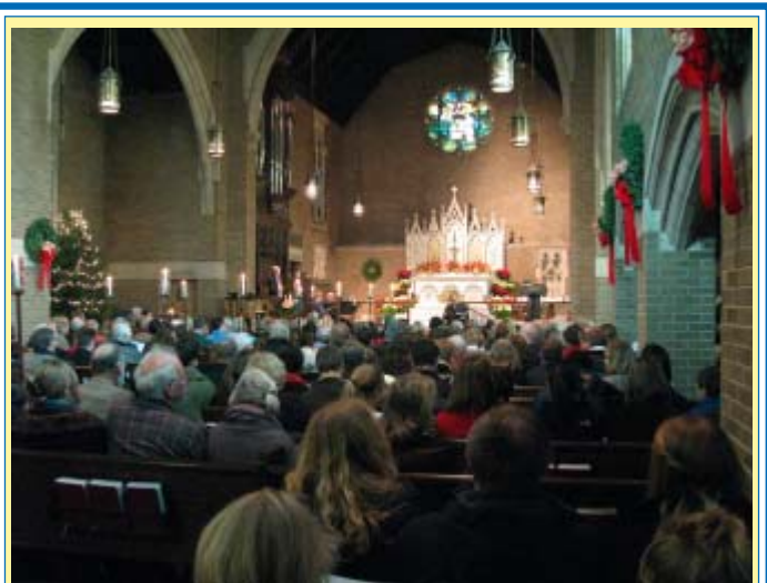
Nordisk julbön: "Den heliga natten"

Om du har goda idéer eller förslag för vår kyrka kan du kontakta någon i kyrkorådet: